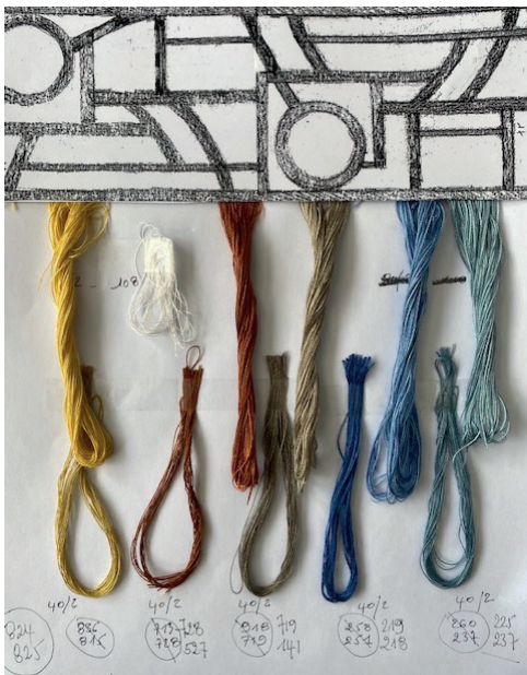
Sélection des fils...